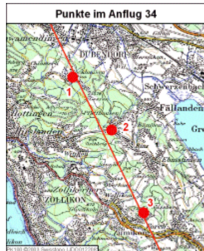
JPG, 468kb (Vorschau anklicken)

Der rote Strich rechts zeigt den Anflug auf Piste 16