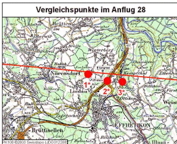
JPG, 190kb (Vorschau anklicken)